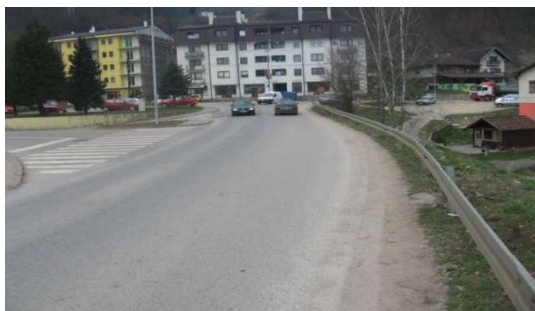
Слика 3. Поглед на раскрсницу из правца централног подручја општине