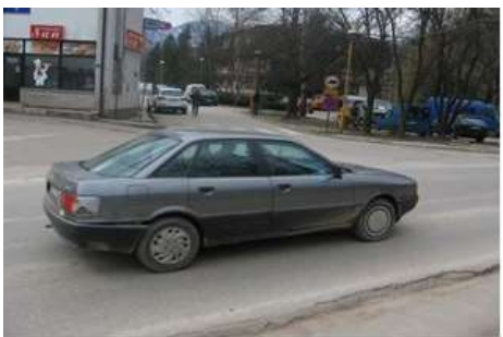
Слика 7. Раскрсница улица Петра Петровића Његоша, светог Николе и цара Душана