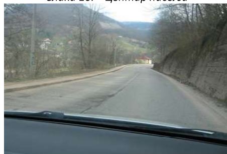
Слика 12. Насеље Mилићи