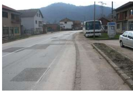
Слика 10. Центар насеља