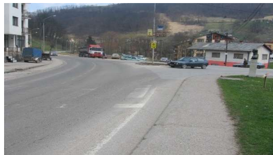
Слика 2. Поглед на раскрсницу из правца Власенице