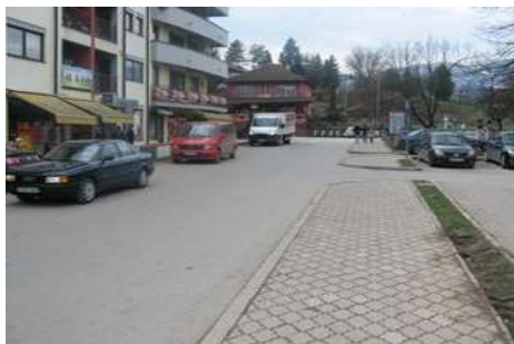
Слика 5. Трг Рудара укључење са улице цара Душана

Наведене улице налазе се у централном подручју урбаног дјела насеља Милићи и представљају најфреквентније улице у насељу Милићи јер се у њима налази највећи број институција и привредних субјеката који генеришу значајан број моторних возила, а посебно пјешака. Иако је централно подручје, у предметном подручју изграђеност пјешачких површина није адекватна. Поред наведеног недовољно поштовање возача моторних возила према пјешацима као рањивој категорији учесника.