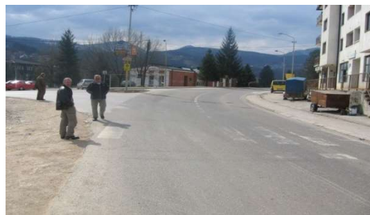
Слика 4. Поглед на раскрсницу из Зворника.