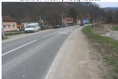
Слика 11. Насеље Дубница – „зона школе“