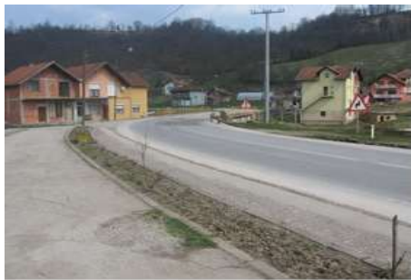
Слика 9. Мост у Новој Kасаби