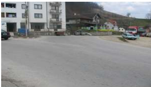
Слика 1. Укључење са регионални на маг. пут

Наведена раскрсница улица представља укрштање Магистралног пута Зворник- Сарајево и Регионалног пута Милићи-Палеж-Сребреница, и представља најзначајније мјесто преко којег се приступа централном подручју општине Милићи, односно руднику боксита који представља окосницу развоја Општине Милићи. Обезбјеђивање простора за кретање тешких теретних моторних возила, условило је да се наведена раскрсница регулише на начин који многе учеснике у саобраћају доводи у незавидан положај, при чему често долази од акцидентних ситуација. Централни дио ове трокраке раскрснице чини зелено острво са стубом расвјете у централној зони острва, који свакако омета учеснике у саобраћају у остваривању адекватне прегледности. Када се претходно наведеним проблемима дода и ријетко обнављање хоризонталне сигнализације, не може а да се не закључи да је ниво безбједности саобраћаја за све учеснике у саобраћају а посебно за пјешаке на врло ниском нивоу. У оквиру фотографија 1-4 приказано је стање раскрснице