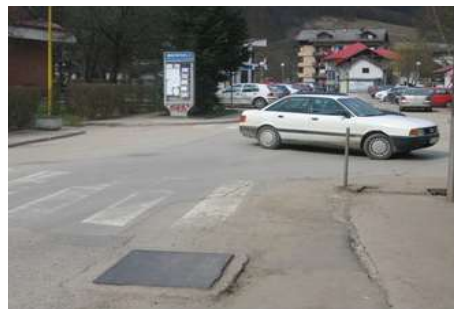
Слика 6. Ул.В.С.Караџића и Ул.Солунска