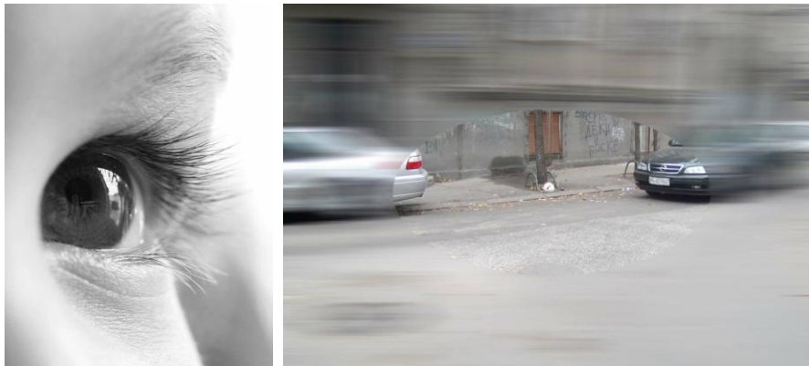
Slika 1. Vidno polje djeteta je uže nego kod odrasle osobe.

S obzirom na to da djeca mlađa od 12 godina nedovoljno dobro procjenjuju udaljenost automobila i vrijeme koje im je potrebno da pređu ulicu, a uz to su im pažnja i periferni vid slabiji nego kod odraslih, (slika 1) i kako ne mogu uvijek tačno da odrede pravac iz kojeg dolazi zvuk, potrebna im je pomoć odraslih učesnika u saobraćaju, kao i znanje o elementarnim pravilima ponašanja koje će njihovo kretanje učiniti bezbjednijim i dati im osjećaj sigurnosti.