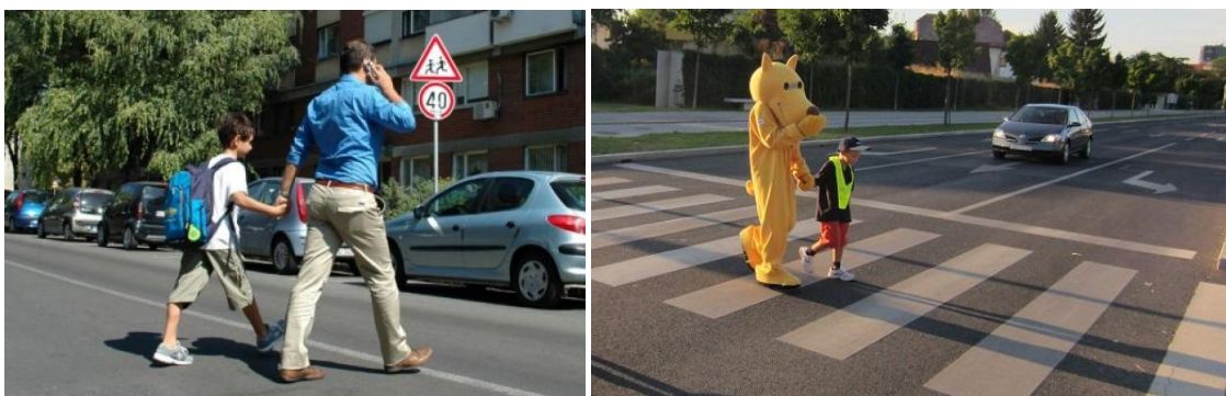
Slika 2. Roditelji i djeca u saobraćaju!

Kada govorimo o neodgovornim odraslim osobama, važno pitanje je kako će dijete sa takvim roditeljima izgraditi pozitivne saobraćajne stavove i kulturu. Ako djeca nauče saobraćajna pravila i elemente saobraćajne kulture, a njihovi roditelji to vidno krše te dovode djecu u rizične situacije, to može dovesti do njihove zbunjenosti i otežanog usvajanja elemenata saobraćajne kulture. Na jednoj strani dijete zna šta je ispravno i kako se treba ponašati, a na drugoj strani, zbog svoje prirodne konstitucije i relacije roditelj – dijete, ono nije u stanju da spriječi takva neadekvatna ponašanja. Nameće se zaključak da je poželjno jačati ličnost djeteta i motivisati dijete da izrazi svoj stav o određenoj situaciji u saobraćaju, kao i da iskaže svoje emocije straha ili neke druge emocije, slika 2.