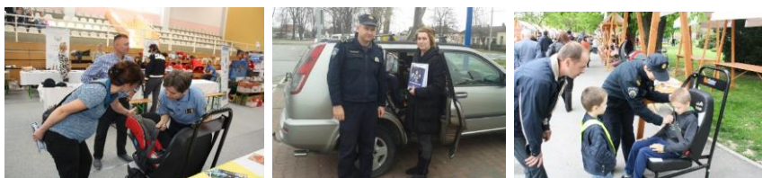
Slika 8. Informiranje građana na Info-točkama

Info-točke ili info-štanđovi (Slika 8.) daju dobru priliku svim zainteresiranim građanima da se informiraju o stanju sigurnosti u cestovnom prometu, isprobaju demo-sjedalo i pravilno montiranje dječjih autosjedalica. Info-točke organiziraju se na mjestima većeg broja okupljanja građana neovisno o tome da li se radi o gradskim trgovima, trgovačkim centrima, parkirališnim mjestima ili značajnijim događanjima.