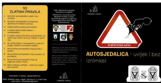
Slika 11. Letak udruge Roditelji u akciji – Roda