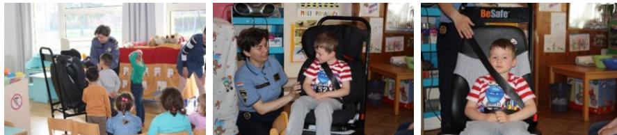
Slika 1. Edukacije u dječjim vrtićima

Slijedeći korak je odlazak u dječje vrtiće (Slika 2., 3. i 4.) koji uvijek izaziva puno pozornosti i veselja. Na demo-sjedaću se odgojiteljicama i djeci pokazuje kakve opasnosti vrebaju ako se sigurnosni pojas i autosjedalice ne koriste kako treba. Naravno, pritom nitko nije ozlijeđen, pa čak niti medvjedići i lutke koji služe kao pomagači. Imajući u vidu čl. 163. Zakona o sigurnosti prometa na cestama (Narodne novine, 92/2014), i fizički razvoj djece, kao pomagalo koristi se i metar, te se djeca kroz igru i prometne radionice izmjere koliko još trebaju narasti da bi mogla koristiti isključivo sigurnosni pojas odnosno koliko još trebaju koristiti autosjedalicu jer sigurnosni pojas za njihovu dob, nije siguran.