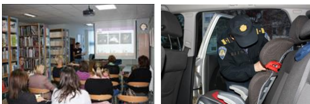
Slika 7. Edukacija o prijevozu djece i pregled dječjih autosjedalica

Samostalno i u suradnji s volonterima udruge Roda, organiziraju se edukacije i preventivni pregledi dječjih autosjedalica u zonama dječjih vrtića i gradskih knjižnica (Slika 7.).