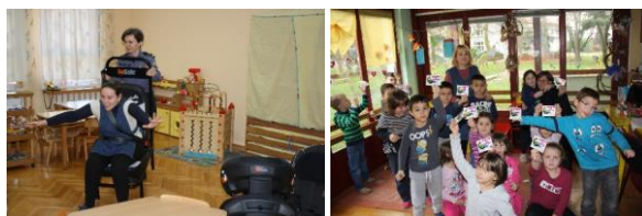
Slika 3. Edukacije u dječjim vrtićima

Kako bi predavanja bila zanimljivija, kroz priču o Djedu Mrazu koji se nije vezao pojasom i zamalo rastužio djecu u Europi, dodatno se ukazuje da bez pojasa i autosjedalice možemo puno toga izgubiti. Ova priča potaknula je udrugu Roda na izdavanje slikovnice „Neobična želja“ (Vusić, 2016. g.).