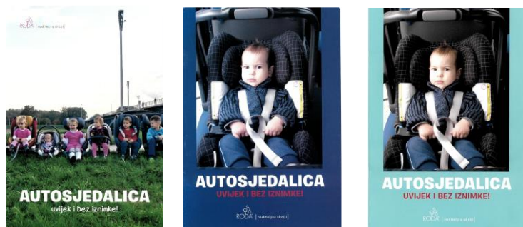
Slika 10. Brošure udruge Roditelji u akciji - Roda