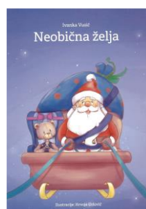
Slika 5. Slikovnica udruge Roditelji u akciji - Roda

Kako bi predavanja bila zanimljivija, kroz priču o Djedu Mrazu koji se nije vezao pojasom i zamalo rastužio djecu u Europi, dodatno se ukazuje da bez pojasa i autosjedalice možemo puno toga izgubiti. Ova priča potaknula je udrugu Roda na izdavanje slikovnice „Neobična želja“ (Vusić, 2016. g.).