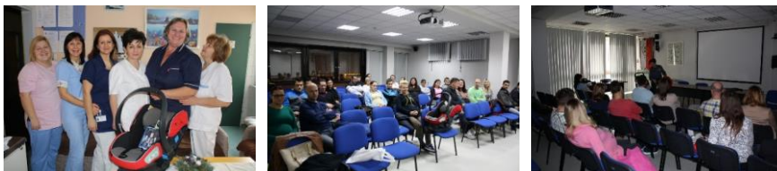
Slika 1. Edukacije na Odjelu rodilišta i tečajevima za trudnice u Općoj bolnici „Dr. Tomislav Bardek“ u Koprivnici

Obzirom da na ponašanje sudionika u prometu treba djelovati u najranijoj dobi, pa čak i prije nego što se dijete rodi, tijekom organiziranih tečajeva za trudnice i edukacije na Odjelu rodilišta u Općoj bolnici „Dr. Tomislav Bardek“ budućim roditeljima i majkama se pokazuje kako se autosjedalice za novorođenčad trebaju koristiti. Pritom se „uživo“ ukaže na najčešće greške koje roditelji čine te objasne zlatna pravila korištenja autosjedalica. Kako ne bi sve ostalo na preventivi, uvijek se spomene i sankcija koja je predviđena Zakonom o sigurnosti prometa na cestama Republike Hrvatske ukoliko se sigurnosni pojas i autosjedalice ne koriste ili se nepravilno koriste. (Slika 1.)