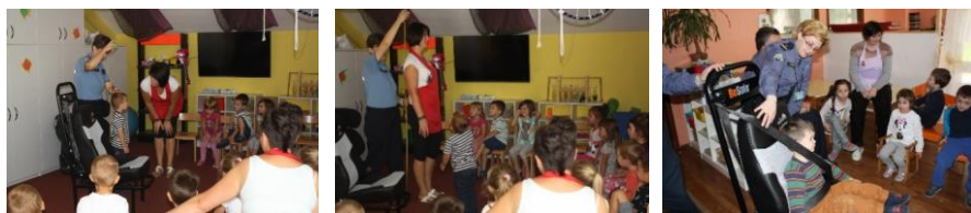
Slika 2. Edukacije u dječjim vrtićima