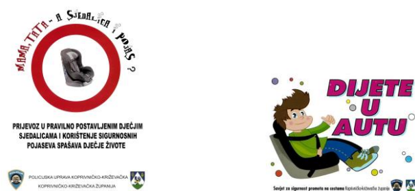
Slika 9. Preventivni materijali Savjeta za sigurnost prometa na cestama Koprivničko-križevačke županije i Policijske uprave koprivničko-križevačke

Svi spomenuti preventivni materijali služe za bolju informiranost roditelja, zdravstvenih radnika i odgojitelja, te su ujedno podsjetnik svima da se o sigurnosti u prometu treba svakodnevno voditi računa.