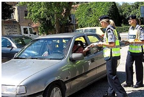
Slika 4. Preventivna akcija ciljane kontrole vozila (Karlovac)