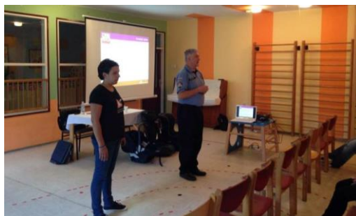
Slika 2. Predavanje za roditelje u Karlovcu, 2016. g.

Također, u mnogim lokalnim zajednicama tijekom proteklih 12 godina lokalna prometna policija pružila je svojim prisustvom ili aktivnim sudjelovanjem podršku lokalnim Rodinim volonterima u organizaciji akcija besplatnih pregleda autosjedalica (Slika 3.). Prisustvo policije na ovim aktivnostima nosi nekoliko dobrobiti. One uključuju javno prepoznavanje uloge koju nose policajci u jačanju sigurnosti djece u prometu među roditeljima i drugim vozačima koji su posjetili akciju, kao i predstavnicima medija koji često prate ove akcije. One također uključuju i priliku za pripadnike prometne policije da aktivno stječu znanja potrebna u sklopu njihovog profesionalnog rada kroz promatranje dijagnosticiranja grešaka i savjetovanja korisnika od strane Rodinih savjetnica o autosjedalicama. I, konačno, ovakve akcije pružaju priliku da se javno prikaže pozitivan primjer suradnje između državnih organizacija i organizacija civilnog društva, suradnje koja je prepoznata i priznata kao ključan čimbenik u donošenju pozitivnih društvenih promjena.