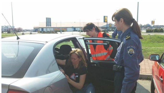
Slika 3. Rodin pregled autosjedalica (Varaždin)

Uz javne akcije kao što su besplatni pregledi autosjedalica, udruga Roda, predstavnici Službe za sigurnost cestovnog prometa, policijskih uprava i lokalnih prometnih postaja te predstavnici drugih društvenih dionika zajedno sudjeluju u raznim javnim okupljanjima. To uključuje sudjelovanje u okruglim stolovima, simpozijima, javnim manifestacijama i drugim događanjima. Uz priliku da se javnosti predstavi suradnja i zajednički glas svih dionika koji potiče jačanje sigurnosti djece kao putnika u prometu, akcije ovakve vrste također su prilike za razmjenu znanja i iskustva među dionicima te diskusiju, razmjenu ideja i razvoj budućih inicijativa.